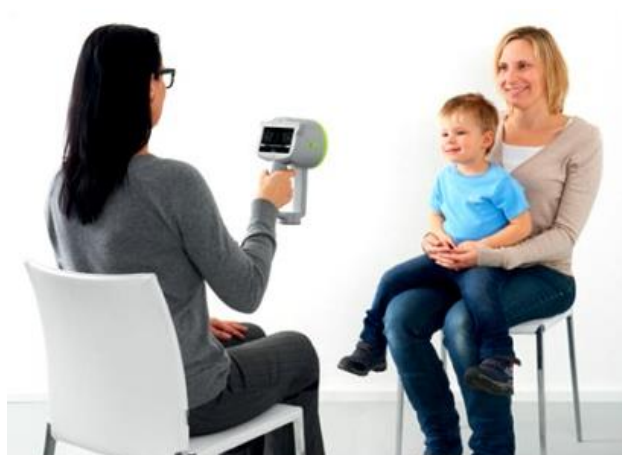
Realização do exame de rastreio

O resultado é enviado por carta para a sua residência. A sua equipa de saúde familiar também recebe essa informação.